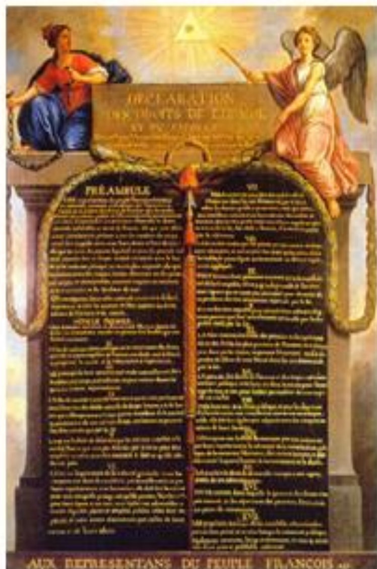
Dichiarazione Diritti dell'Uomo 1789