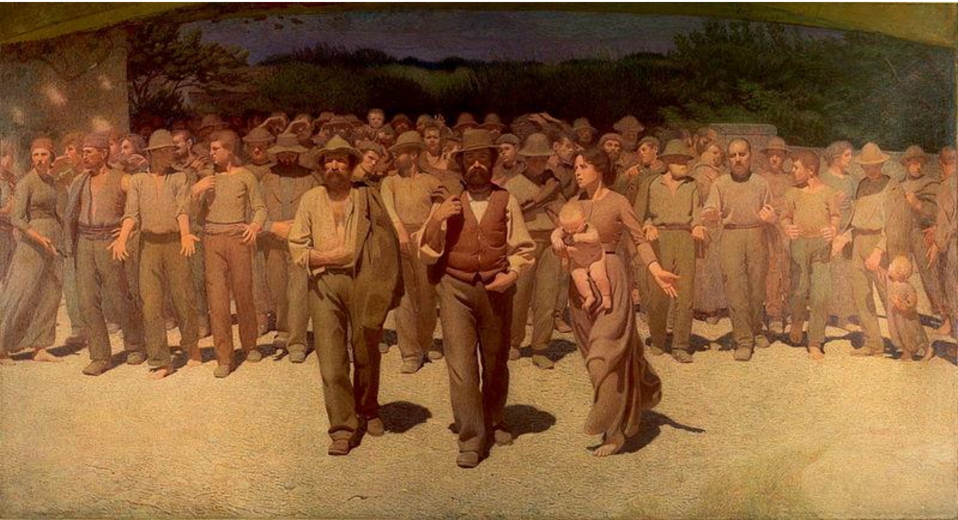
GIUSEPPE PELLIZZA DA VOLPEDO, 1901